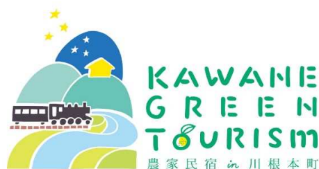
かわねグリーンツーリズムロゴ作成