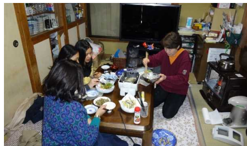
もう一つの家族に(民泊最大の魅力)