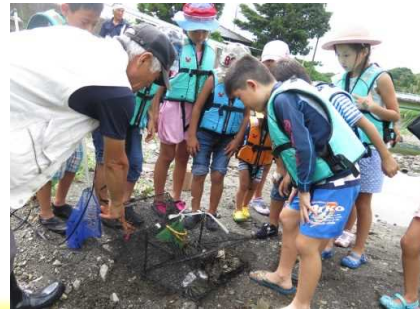
子ども向けイベントの様子～夏の川遊び～