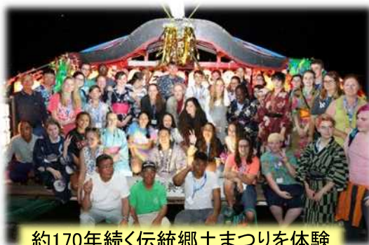
約170年続く伝統郷土まつりを体験