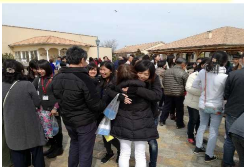
地元住民と受入学生の見送り