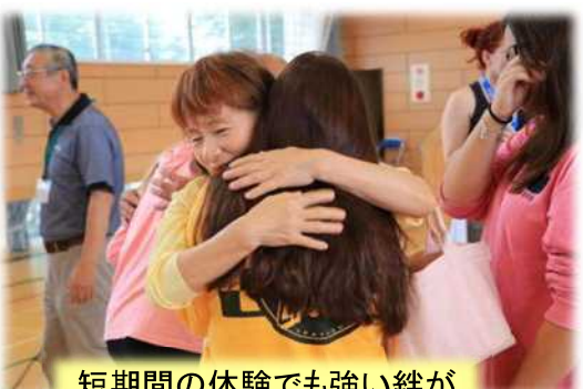
短期間の体験でも強い絆が