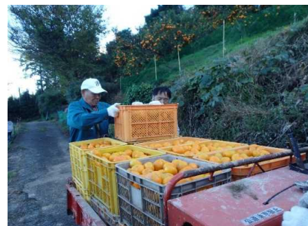
みかん農家援農支援の様子