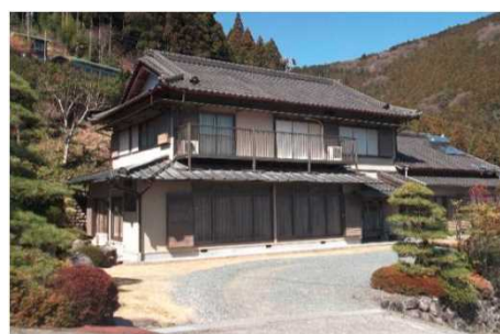
農家民宿「天空の宿」