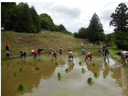
都市住民グループの米作り体験の様子