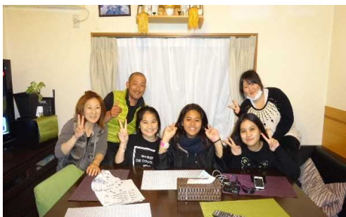
言葉の壁を越えた交流(インバウンド)