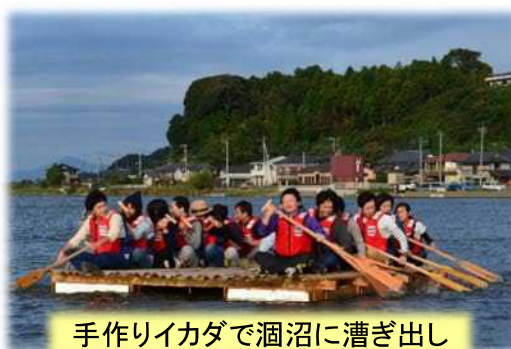
手作りイカダで涸沼に漕ぎ出し