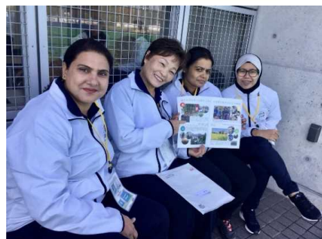
各種イベント時でのPR