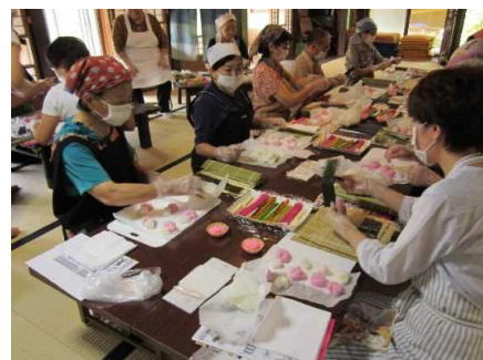
「平群郷土料理塾」の様子