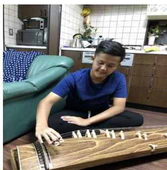
日本の文化を体験