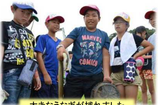
大きなうなぎが捕れました