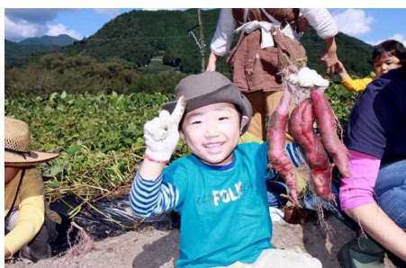
SLが通る畑でのイモ堀り体験開催