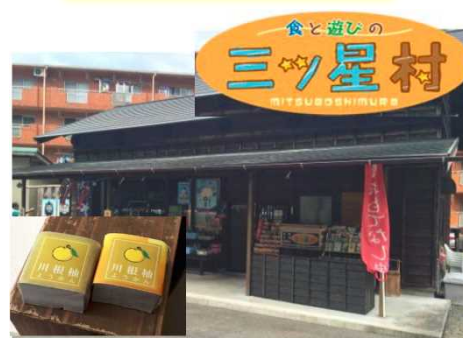
食と遊びの三ツ星村