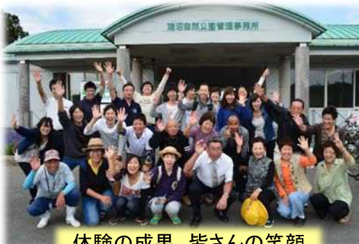
体験の成果、皆さんの笑顔