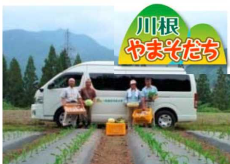
川根農産物直送便