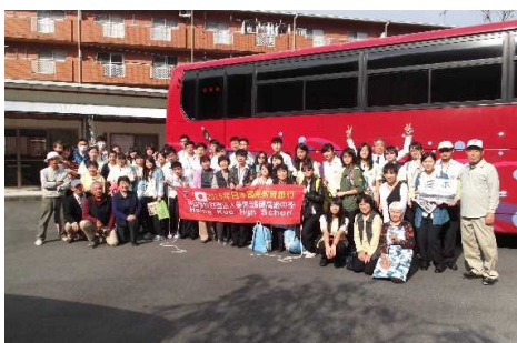
初めての台湾修学旅行受け入れ