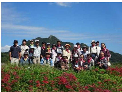
「平群を歩く」の様子